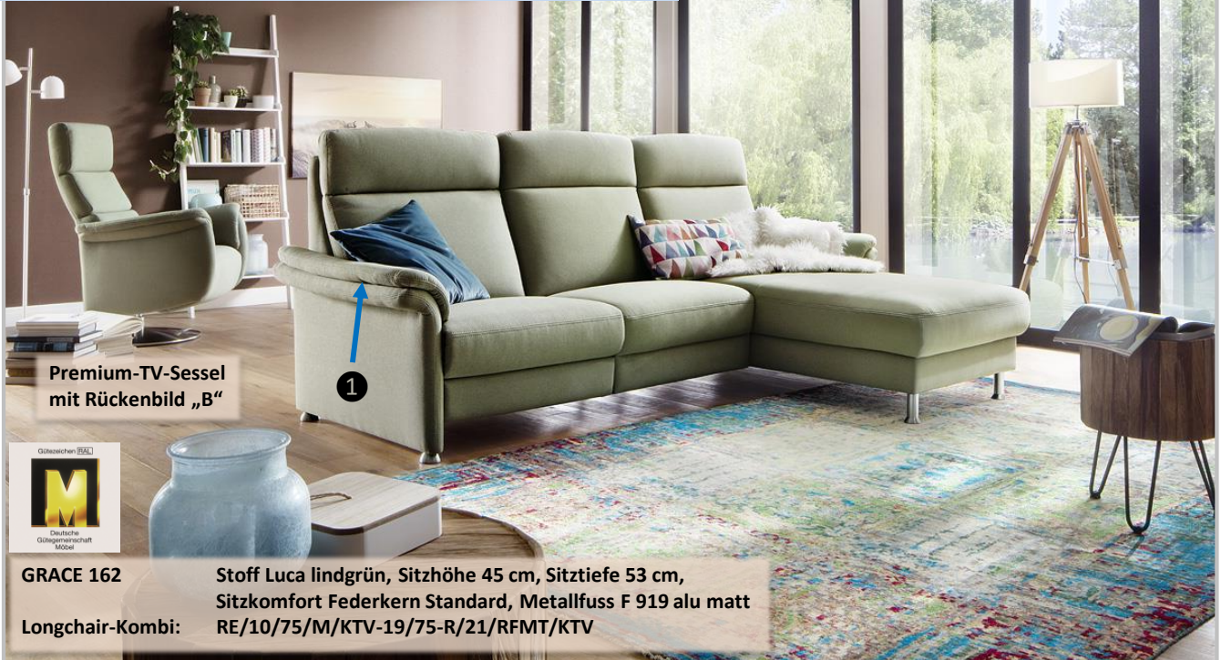
Premium-TV-Sessel mit Rückenbild „B“