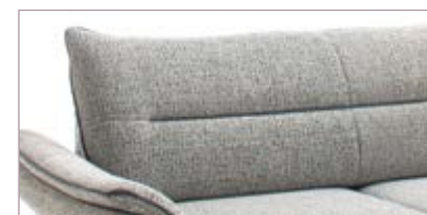
Rücken mit Keder (Standard)