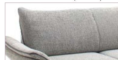
Rücken glatt (Variante)